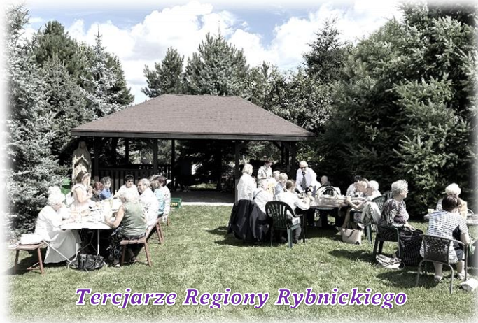
Tercjarze Regionu Rybnickiego