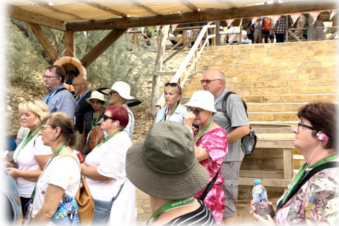
1-4. Odnowienie chrztu świętego w rzece Jordan – po stronie Jordańskiej. Wszystko pod bacznyim okiem żołnierzy jordańskich, a z ukrycia wojska izraelskiego; 5. i 6. Odnowienie przyrzeczeń małżeńskich w Kanie Galilejskiej.

Wszystkim Parafianom, naszym rodzinom, bliższym i dalszym, przyjaciołom i sąsiadom oraz ludziom dobrej woli dziękujemy za wsparcie modlitewne i troskę w czasie naszej parafialnej pielgrzymki do Ojczyzny Jezusa.