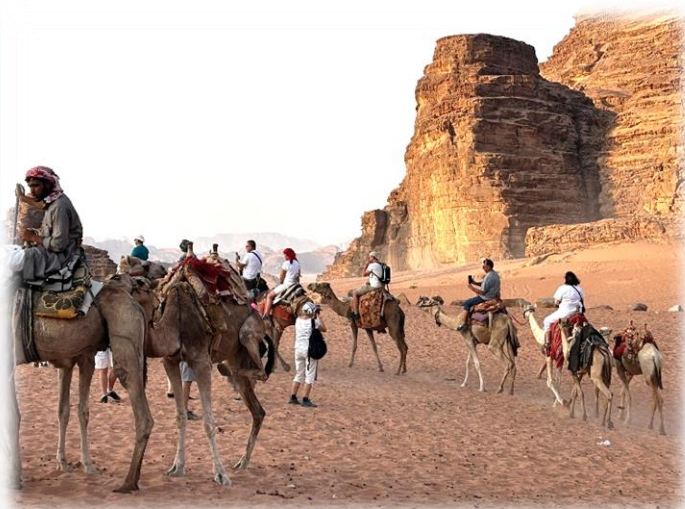
1. i 3. Petra, starożytne miasto w Jordanii; 2. i 4. Pustynia Jordkańska.