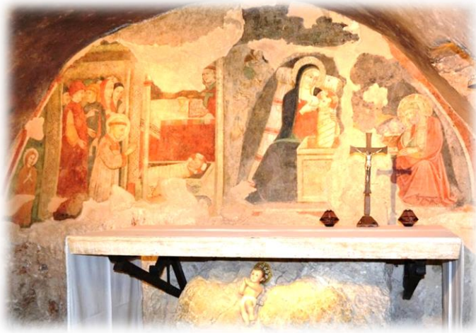
Fresk namalowany w grocie, w której św. Franciszek po raz pierwszy przygotował scenę na święta Bożego Narodzenia. Greccio.