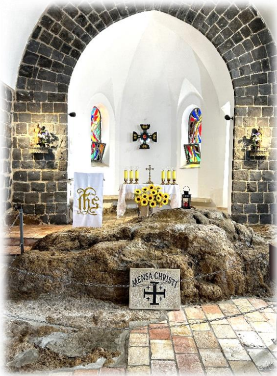
1. Tabga. Miejsce prymatu św. Piotra.

Strach i obawy towarzyszące zbliżającemu się wyjazdowi do Ziemi Świętej i dziesiątki dziesiątek Różańca odmawianego w tej intencji na długo przed wyjazdem.